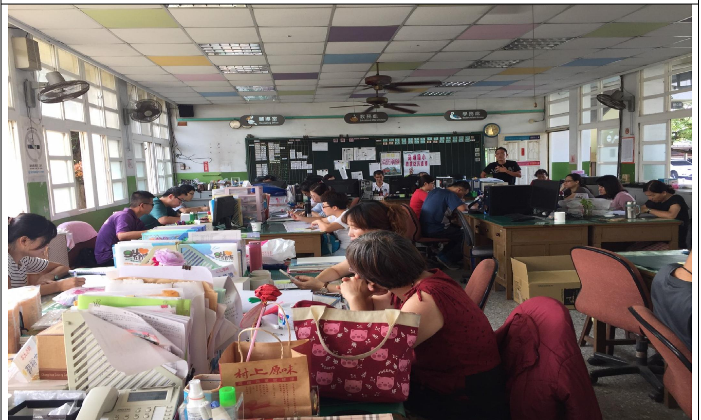
說明：學校同仁利用晨會協同修正校園演練計畫之情形。