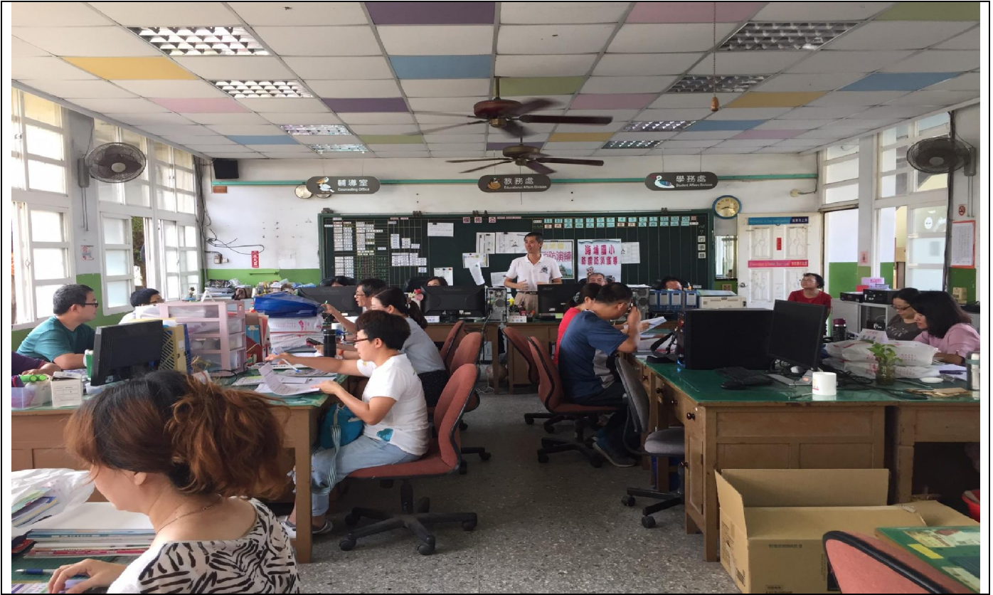
說明：校長主持校園演練計畫編訂。